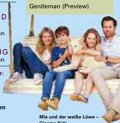
Mia und der weiße Löwe – Cinema Kids

Mi, 27.3.19 20.15 My Big Crazy Italian Wedding (Preview) 20.30 Ein Gauner und Gentleman (Preview)