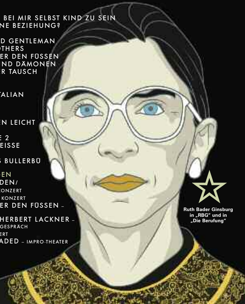
Ruth Bader Ginsburg in „RBG“ und in „Die Berufung“