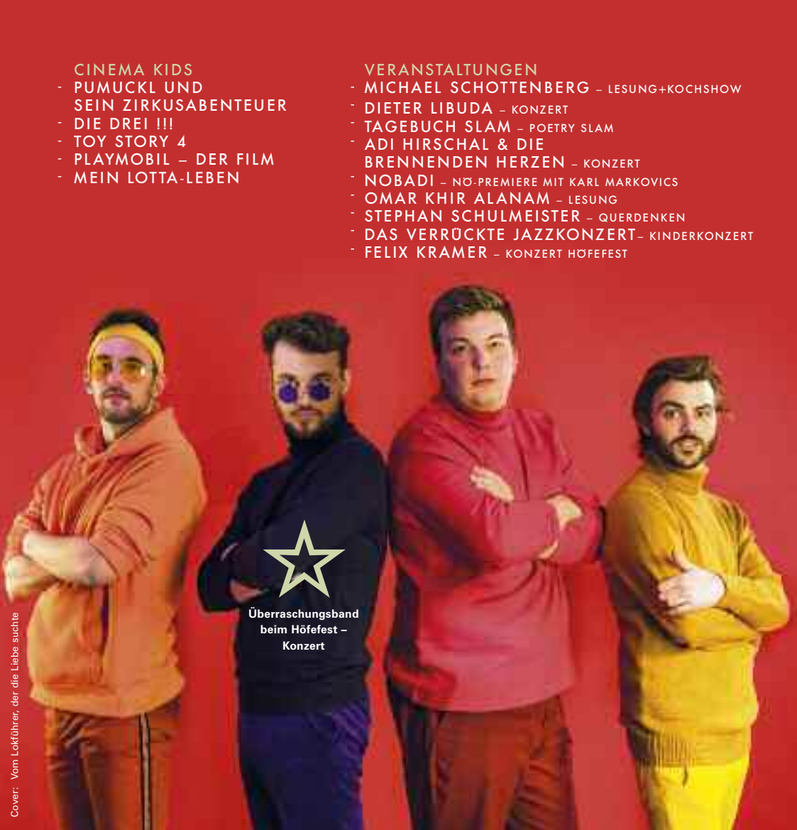
Überraschungsband beim Höfefest – Konzert

Cover: Vom Lokführer, der die Liebe suchte