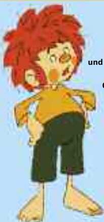
Pumuckl und sein Zirkusabenteuer – Cinema Kids