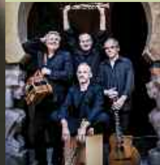
Die Boonies – Cinema Kids